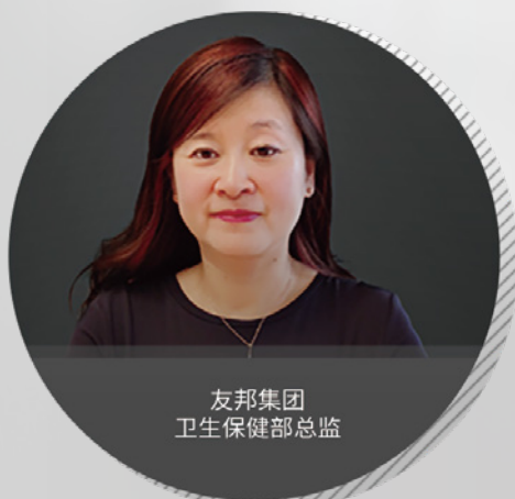
友邦集团卫生保健部总监