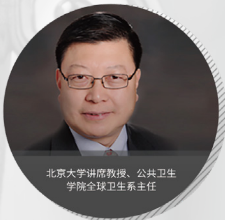
北京大学讲席教授、公共卫生学院全球卫生系主任