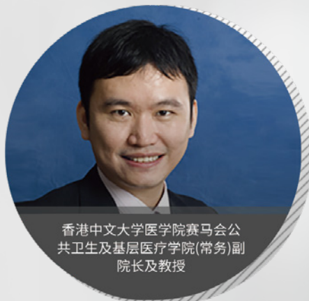
香港中文大学医学院赛马会公共卫生及基层医疗学院(常务)副院长及教授